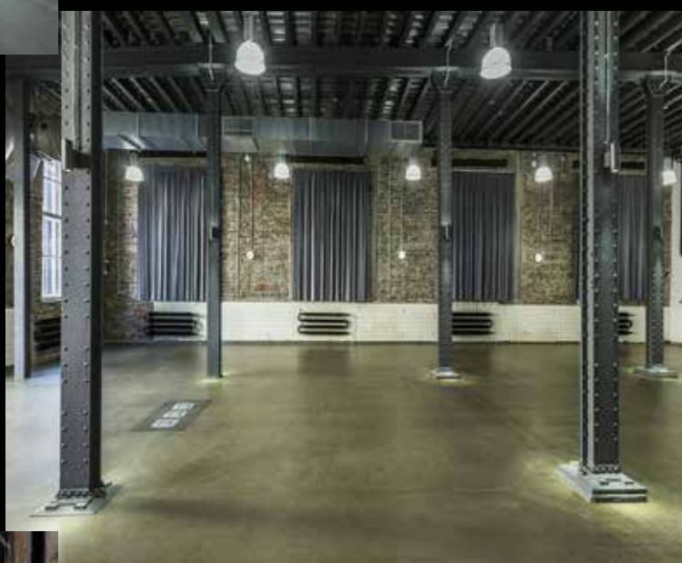
Taneční sál Vystoupení Zdeňka Izera I. patro