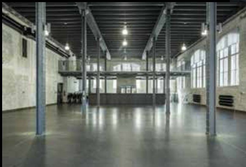
Denní klub Raut Přízemí